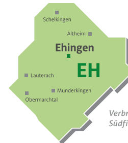
Verbreitungsgebiet Südfinder Ehingen