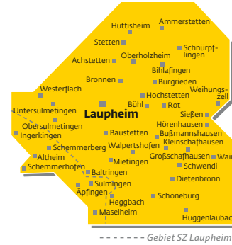
----- Gebiet SZ Laupheim