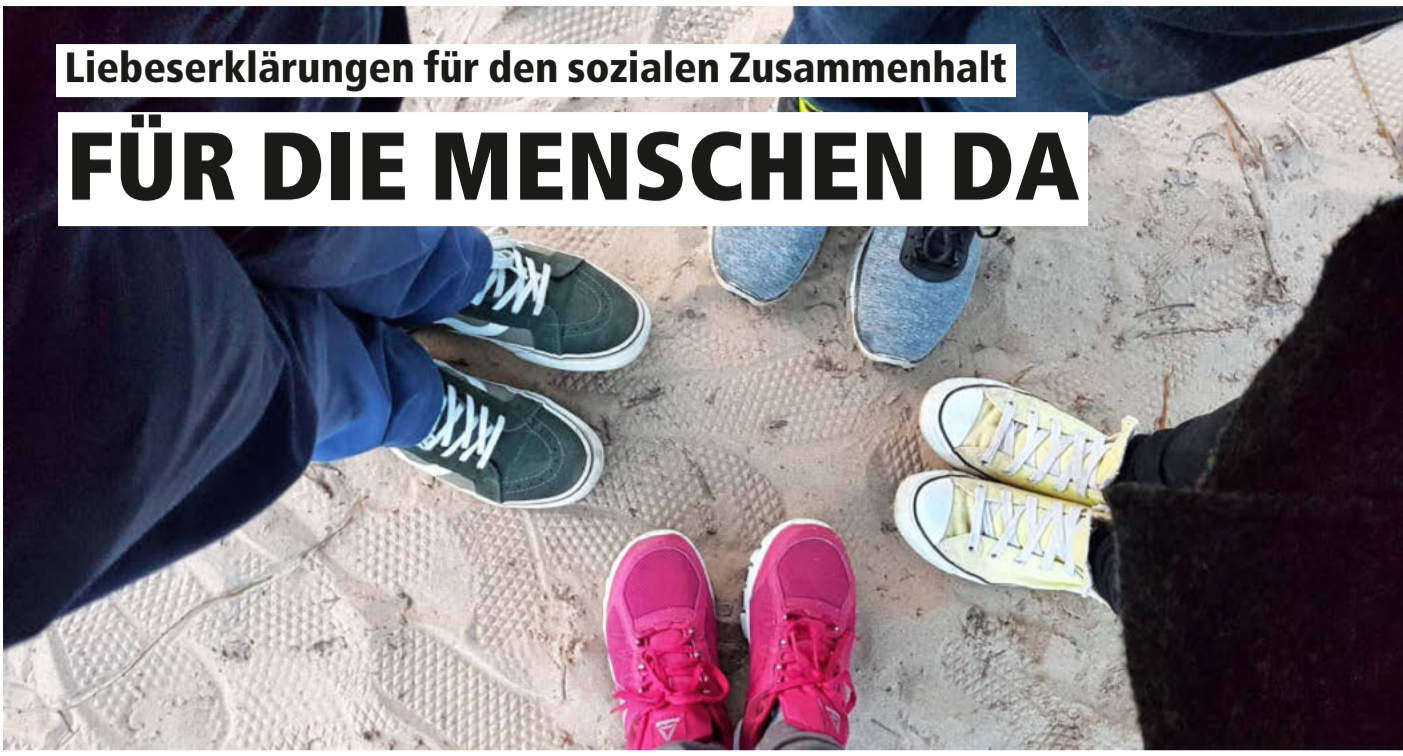
Aufeinander zugehen, füreinander einstehen, aufeinander eingehen – auch dafür leisten Wochenblätter ihren Beitrag.

manchmal auch Interviews mit mir, die viel öfter gelesen werden, als es die meisten jungen Leute glauben. Egal, ob in Corona-Zeiten oder in anderen Zusammenhängen: Hier spiegelt sich die örtliche Welt viel stärker und authentischer wider als in vielen anderen Medien, die über vorgeblich Wichtigeres berichten.“