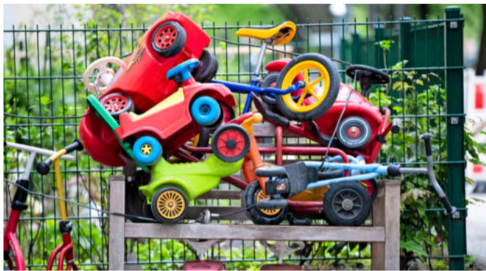
Dicht: Kitas bleiben aufgrund des Coronavirus weiterhin geschlossen.

Die Stadt Heilbronn verzichtet „in allen 98 Kindertageseinrichtungen auf die Kita-Entgelte für Kinder unter drei Jahren während der von der Landesregierung aufgrund der Corona-Pandemie verordneten Schließung der Kindertagesstätten und Kindertagespflege“. Dieser Beschluss gilt sowohl für städtische Kitas als auch für Einrichtungen, die unter kirchlicher oder freier Trägerschaft stehen. Dazu heißt es von Seiten der Stadt: „Der Gemeinderat beschloss die Aussetzung der Kita-Gebühren zunächst für die Mo-